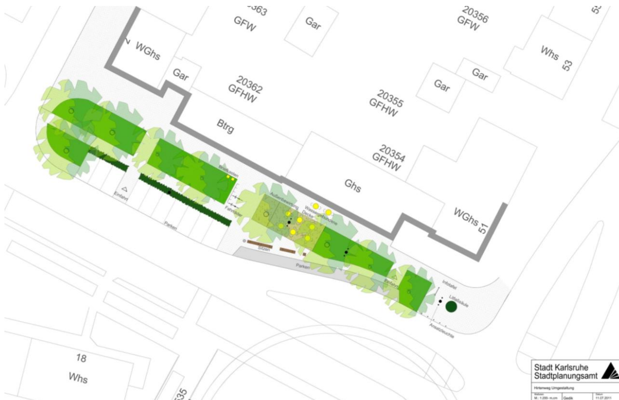
Planungsstand Umsetzungsplanung Stadtverwaltung, Stand Juli 2011

Die anschließende Diskussion umfasst folgende Themen und Anregungen: