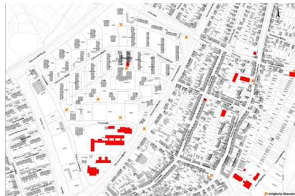
Gestaltungsvorschläge Stadtverwaltung, mögliche Standorte