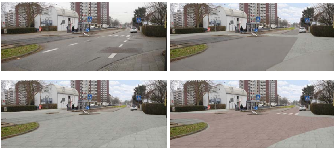
Ausgangszustand und Gestaltungsoptionen Kreuzungsbereiche (Bsp. Forststr.)

Zum Planungsstand stellt Herr Kunert in Montagen am Beispiel Forststraße mögliche Gestaltungsoptionen der Kreuzungsbereiche mit Querungsmöglichkeiten am Ostring, an der Rintheimer Hauptstraße, an der Forststraße, der Huttenstraße und der Heilbronner Straße unter Berücksichtigung erster Vorgaben aus dem Planungsverlauf vor. Dabei ist zu diskutieren, wie die Querungssituationen gestalterisch markiert werden sollen: Soll nur die eigentliche Querung gestalterisch abgehoben werden oder soll der Kreuzungsbereich als Ganzes in der Abfolge der Mannheimer Straße markiert werden?