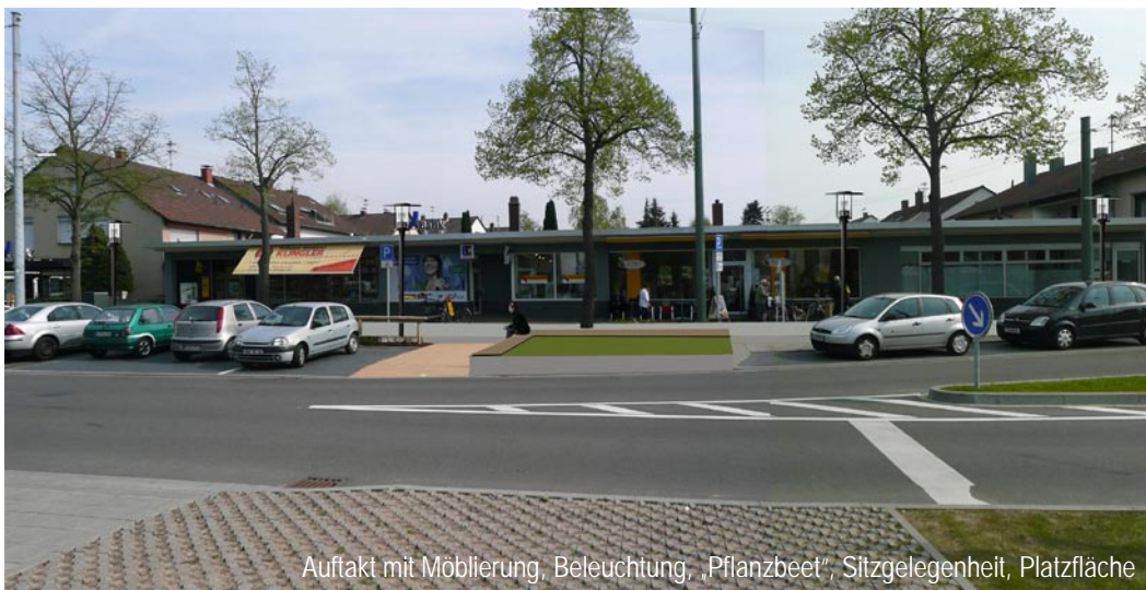
Auffakt mit Möblierung, Beleuchtung, „Pflanzbeet“, Sitzgelegenheit, Platzfläche