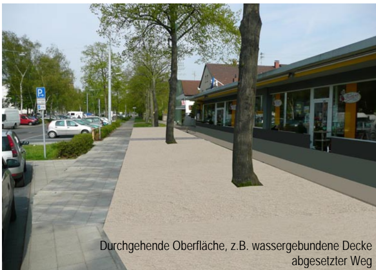
Durchgehende Oberfläche, z.B. wassergebundene Decke abgesetzter Weg