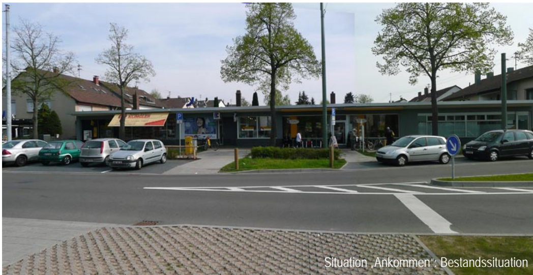
Situation „Ankommen“: Bestandssituation