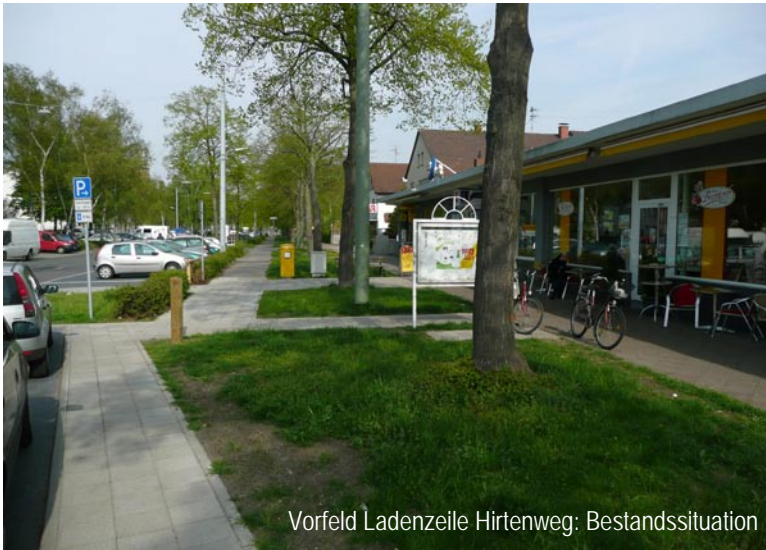
Vorfeld Ladenzeile Hirtenweg: Bestandssituation

Die nachfolgenden Bilder illustrieren anschaulich und beispielhaft die Möglichkeiten, anhand derer die Diskussionen geführt werden: