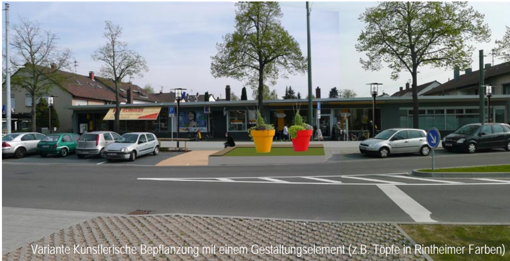
Variante Künstlerische Bepflanzung mit einem Gestaltungselement (z.B. Töpfe in Rintheimer Farben)