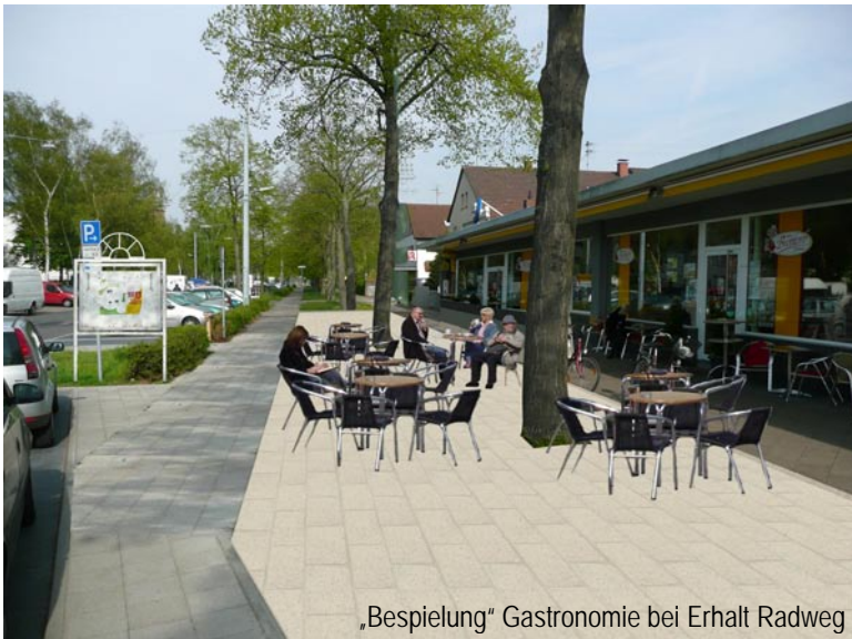
„Bespielung“ Gastronomie bei Erhalt Radweg