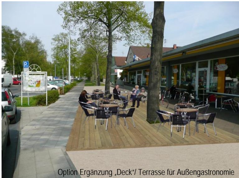
Option Ergänzung „Deck“/ Terrasse für Außengastronomie