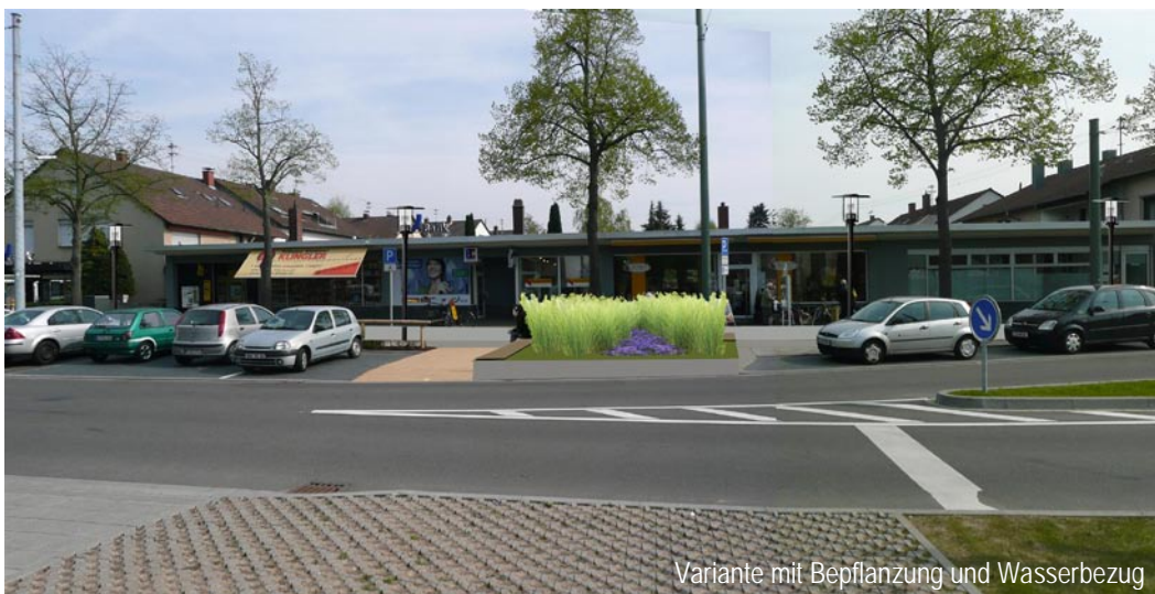
Variante mit Bepflanzung und Wasserbezug