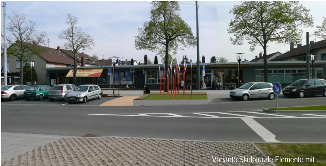
Variante Skulpturale Elemente mit ...