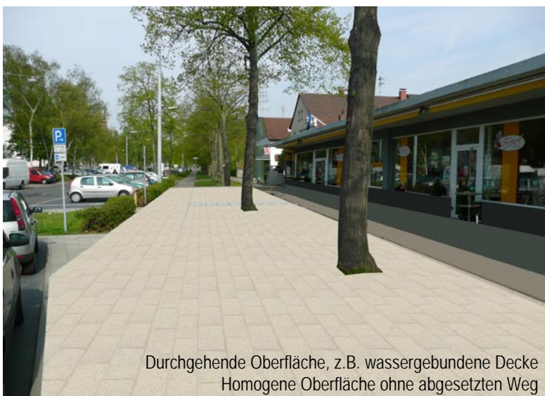
Durchgehende Oberfläche, z.B. wassergebundene Decke Homogene Oberfläche ohne abgesetzten Weg