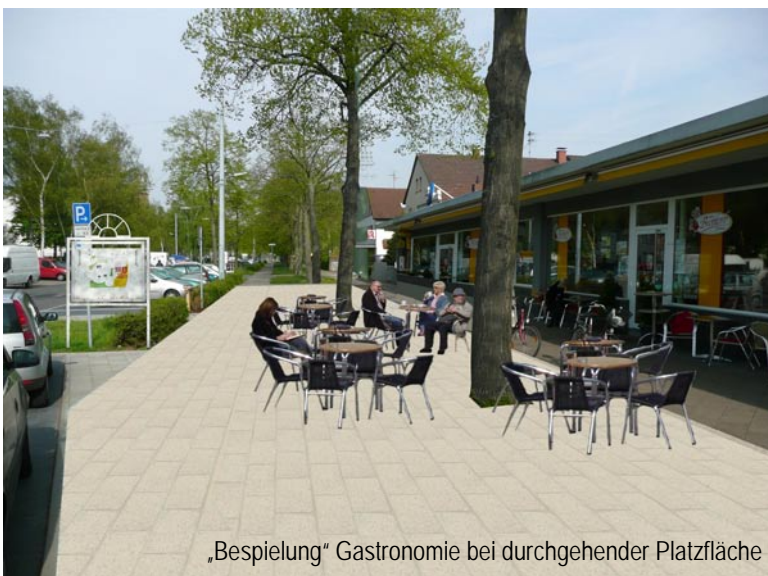
„Bespielung“ Gastronomie bei durchgehender Platzfläche